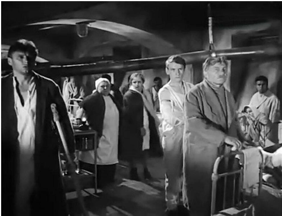
Кадр из фильма «Доктор «Вера»: в подземном госпитале советского доктора.