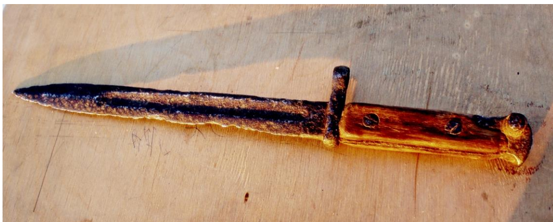
Фото того самого немецкого итыка. Моя мама, пряча его от нас с братом, в целях безопасности, засунула итык под застреху. Когда туда стала попадать вода, он заржавел, так же как и упомянутый ниже пистолет «ТТ».

после того, как этой боевой крупновской сталью забили на мясо нашего поросё, на моих глазах.