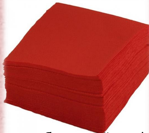
Красные бумажный салфетки