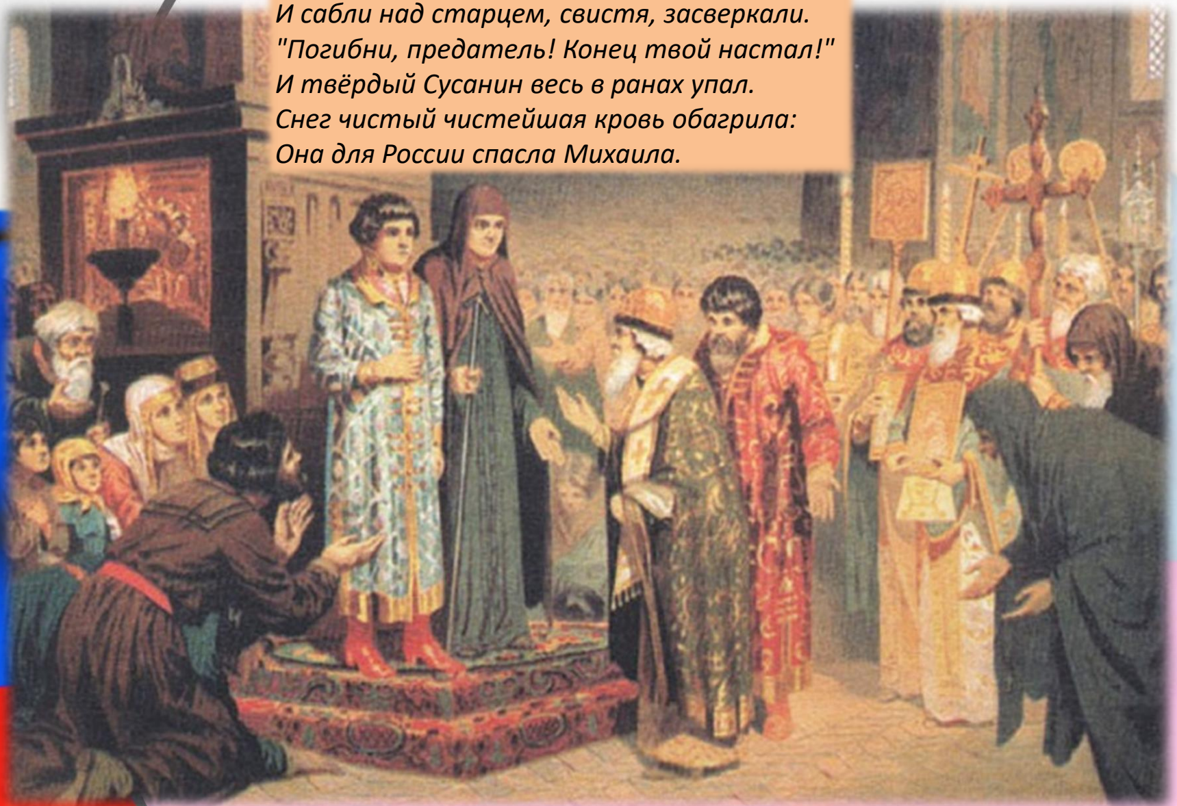
«Избрание Михаила Фёдоровича Романова на царство»

"Умри же!"- поляки герою вскричали, И сабли над старцем, свистя, засверкали. "Погибни, предатель! Конец твой настал!" И твёрдый Сусанин весь в ранах упал. Снег чистый чистойшая кровь обагрила: Она для России спасла Михаила.