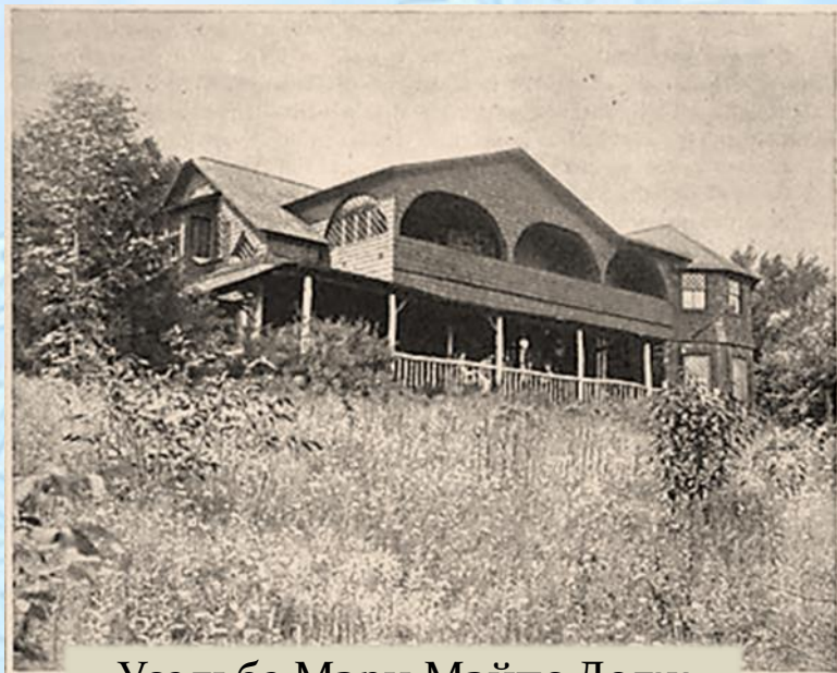
Усадьба Мэри Мэйпс Додж

В браке у неё родилось два сына. Она рано овдовела. Мэри с детьми жили в семейной усадьбе неподалёку от Ньюарка. Здесь она посвятила себя воспитанию сыновей, но позже решила заработать денег на их образование и начала писать. Сарайчик за фруктовым садом был переоборудован в кабинет. Вдали от шума большого дома, здесь в тишине Мэри Додж взялась за работу.