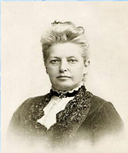
Мэри Мэйпс Додж

Мэри Элизабет Мейп Додж (1831-1905 гг.) — американская писательница и издательница книг для детей.