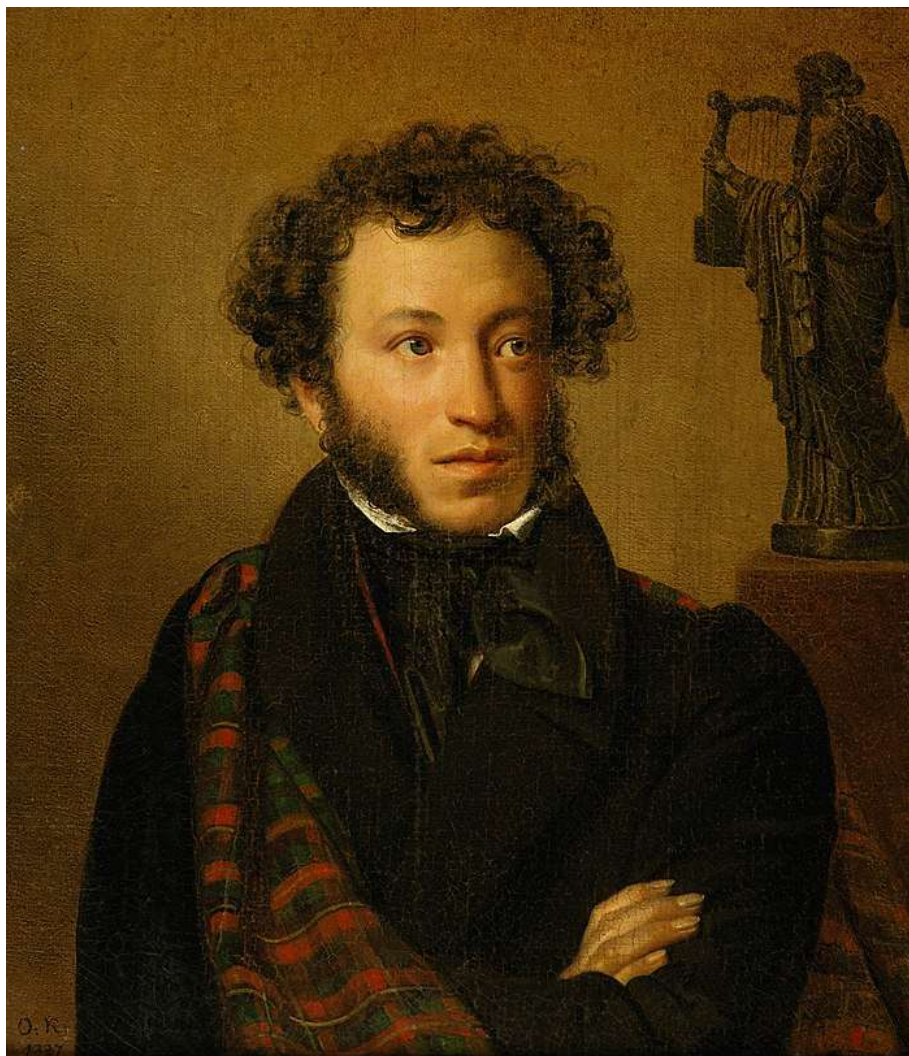
А.С. Пушкин 1799-1837