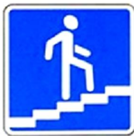
ПОДЗЕМНЫЙ И НАДЗЕМНЫЙ ПЕШЕХОДНЫЕ ПЕРЕХОДЫ