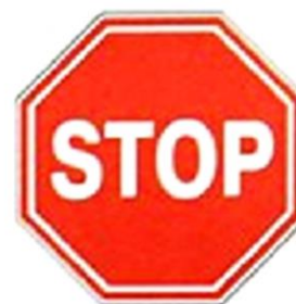
ДВИЖЕНИЕ БЕЗ ОСТАНОВКИ ЗАПРЕЩЕНО