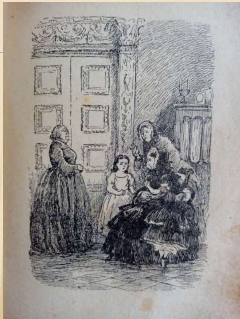
Иллюстрации к книге Н.Петровой.