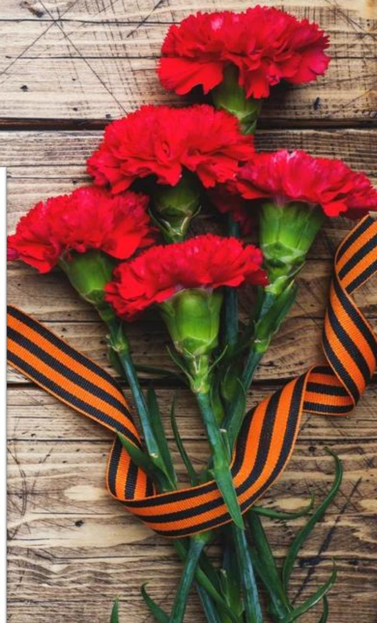
ВАНСЕЦКИЙ ПАВЕЛ ФЕДОРОВИЧ