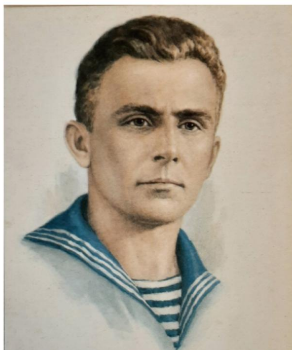
Герой Советского Союза

За беспримерные подвиги он, как и все участники легендарного десанта, удостоен звания Героя Советского Союза.