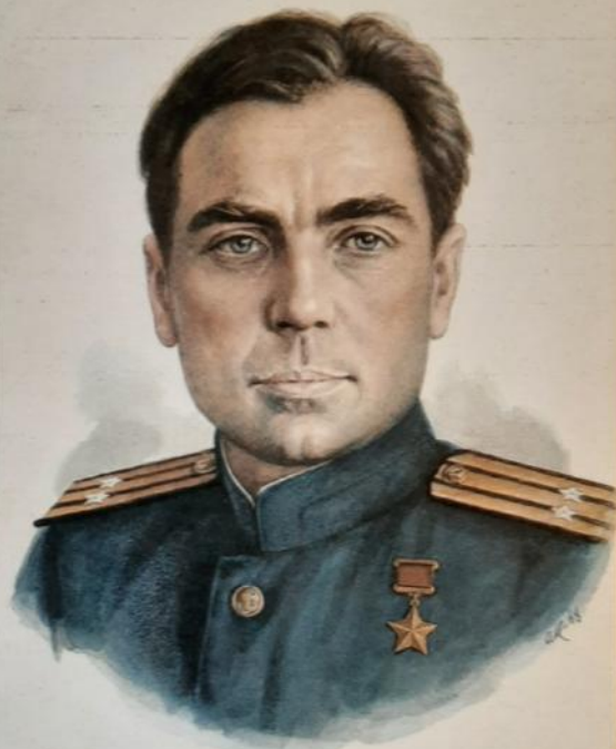
Герой Советского Союза ЛУНИН НИКОЛАЙ АЛЕКСАНДРОВИЧ

Родился в 1907 году, русский, коммунист. В годы Великой Отечественной войны — командир подводной лодки на Северном флоте. Действия Лунина всегда отличались мужеством, высоким воинским мастерством. Его подводные лодки топили немецкие транспорты с войсками и грузами и в открытом море, и на базах противника. Менее чем за год боевых действий экипаж подводной лодки «Щ-421» потопил 7 транспортов противника общим водоизмещением 49 000 тонн.