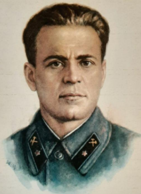
Герой Советского Союза ЗАСЛОНОВ КОНСТАНТИН СЕРГЕЕВИЧ

Родился в 1909 году, командир группы партизанских отрядов Оршанской зоны (Белоруссия).