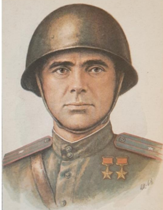
Дважды Герой Советского Союза АРТЕМЕНКО СТЕПАН ЕЛИЗАРОВИЧ