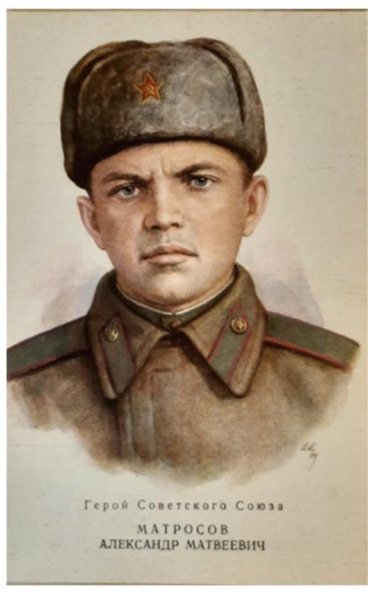
Герой Советского Союза МАТРОСОВ АЛЕКСАНДР МАТВЕЕВИЧ

Родился в 1924 году, русский, комсомолец, стрелок-автоматчик. 23 февраля 1943 года на одном из участков Калининского фронта у деревни Чернушки севернее города Великие Луки развернулись ожесточенные бои. Враг превратил деревню и сильно укрепленный опорный пункт. Несколько раз бойцы поднимались в атаку на фашистские укрепления, но губительный огонь из дзота преграждал им путь. Тогда гвардии рядовой Матросов, пробравшись к дзоту, закрыл своим телом амбразуру. Воодушевленные подвигом Матросова, бойцы поднялись в атаку и выбили немцев из села.