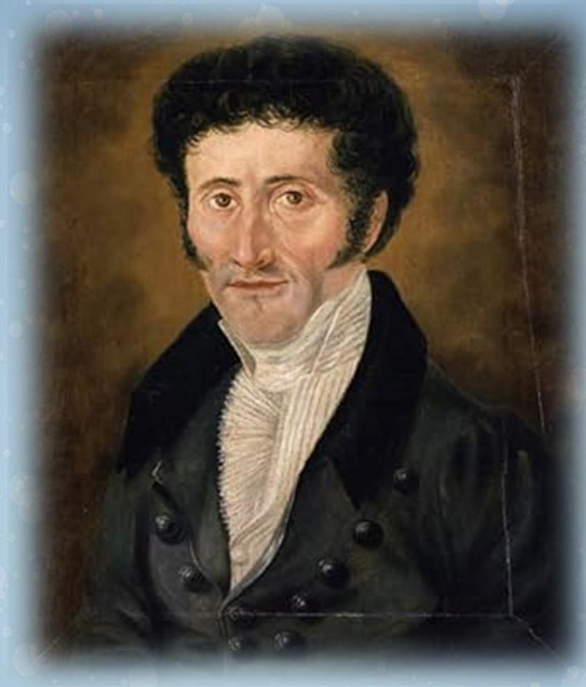
Эрнст Теодор Амадей Гофман

Произведение было написано под влиянием общения автора с детьми своего товарища Юлиуса Гитцига.