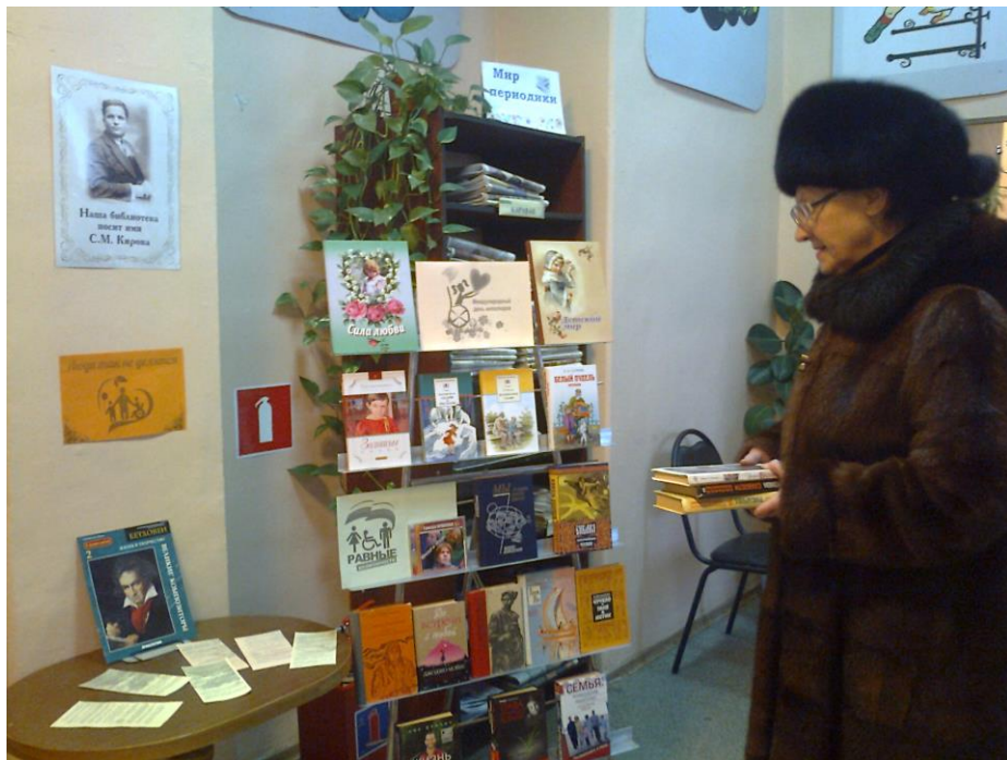
Зав.библиотекой им. С.М.Кирова